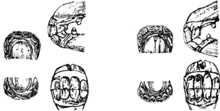
Dientes a los 7 años de edad